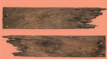
NAT HOUT Hout dat lang in water stond