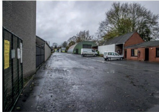
Het recyclagepark wordt vanaf september vernieuwd.