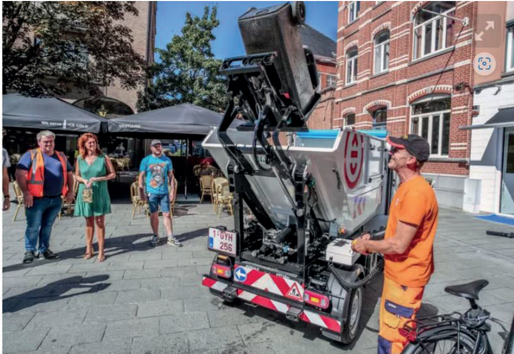
De elektrische ophaalwagen werd woensdagnamiddag voorgesteld, op de Grote Kring in het winkelwandelgebied