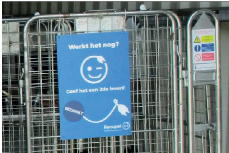
Het recyclagepark van Harelbeke kreeg intussen al speciale draadcontainers geleverd.