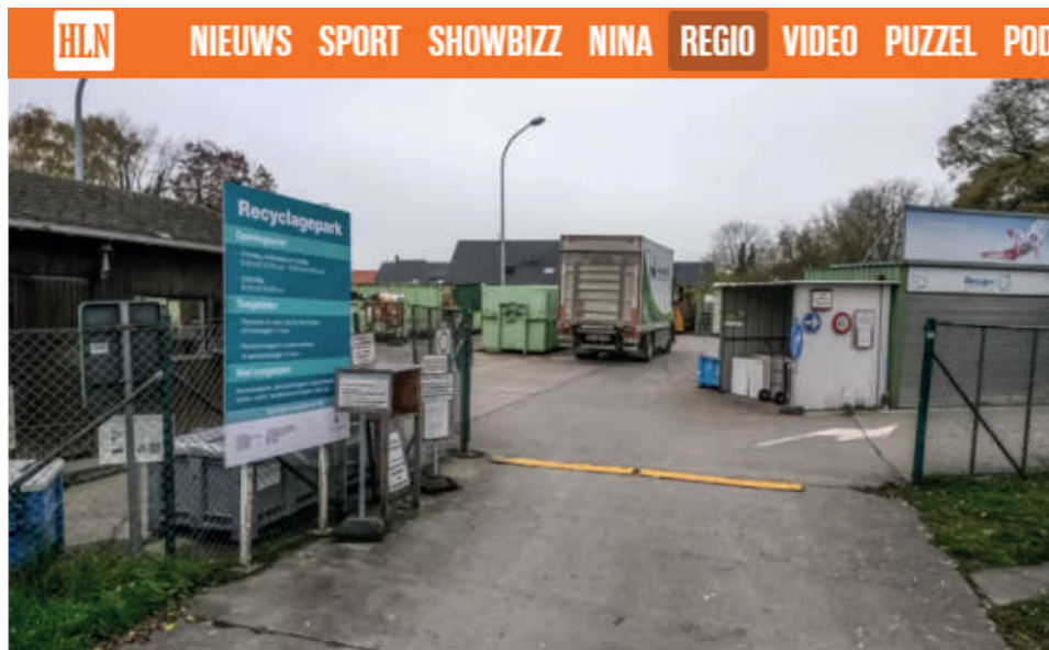
Avelgem is nog een van de laatste containerparken waar geen weegbrug staat.