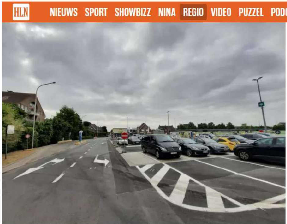
De parking is er al grotendeels aangelegd, en ook de circulatie van en naar de site is al aangepast.