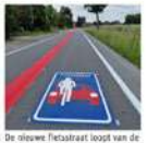
De nieuwe fietsstraat loopt van de Mechelsebaan tot in de kern van Peulis. Daar sluit ze aan op de bestaande fietsstraat. “Daardoor kan je nu zorgeloos tot in Mechelen rijden”, deelt het lokale bestuur mee.

Extra fietsstraat maakt “zorgeloze verbinding” compleet