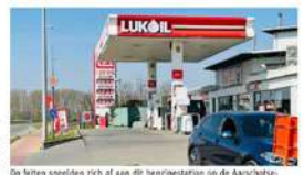
De feiten speelden zich af aan dit tankstation op de Antwerpse steenweg in Lier.

Wettig onderzoek Na zijn veroordeling tot achttien maanden voorwaardelijke gevangenis, bekende de 51-jarige dakwerker zijn schuld. “Mijn client blijft ontkennen. Daarnaast zijn er heel veel onderzoeksbeden niet of nauwelijks uitgevoerd. Nochtans hadden