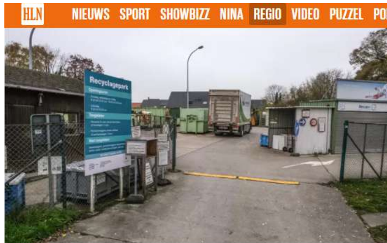
De gunning is al gebeurd, het bestek voor het nieuwe recyclagepark werd een tijdje terug on hold gezet.