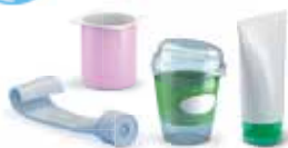
Potjes en tubes