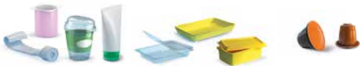
Potjes en tubes