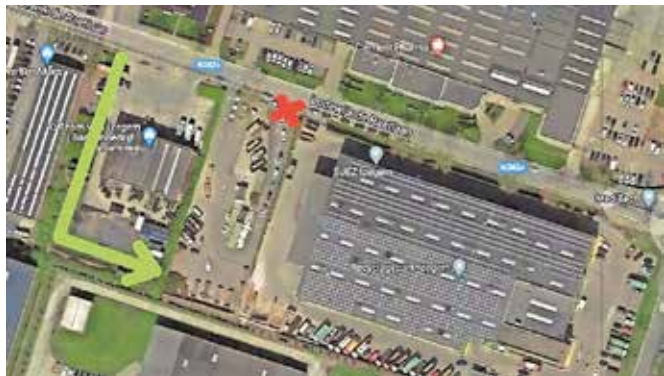
Op een plannetje is duidelijk te zien waar de nieuwe inrijstrook ligt.

De lange rij wachtende wagens aan het recyclagepark in Izegem behoren welra tot het verleden. Op een nieuwe inrijstrook op het terrein van het aanpalend bedrijf zullen straks 30 wagens veilig en weg van de rijbaan kunnen aanschuiven.