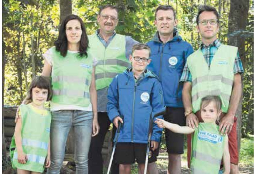
Een aantal vrijwillige Mooimakers uit Groot-Anzegem. (GF)

gen, is er nauwelijks aandacht voor acties rond preventie en verminderen van de totale hoeveelheden afval aangezien het recycleren een winstgevendere bedrijfstak is geworden.”