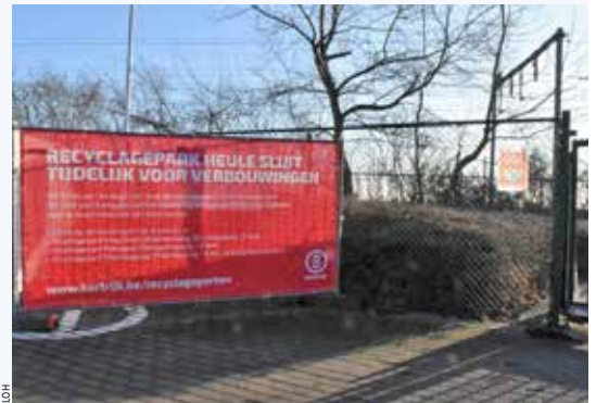
■ Het recyclagepark krijgt onder andere weegbruggen en wordt uitgebreid.

De uitbreidingswerken in Heule liepen vertraging op door een juridisch geschil. Dat is nu altijd niet definitief van de baan. (vkk)