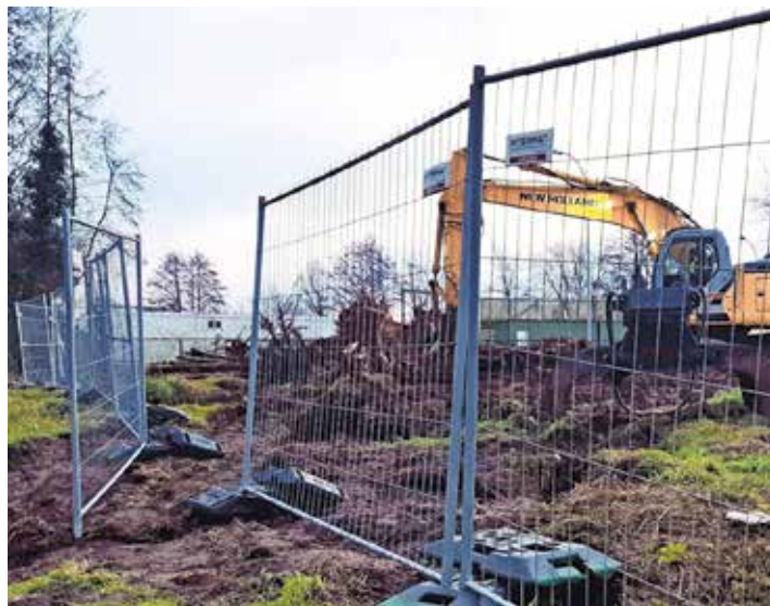
De voorbereidende werken zijn gestart.

Zolang het recyclagepark in Heule gesloten blijft, kan je in de Maandagweg in Kortrijk nog met gratis afvalfracties terecht. En tijdens de werken worden de openingsuren van de parken in Rollegem en de Maandagweg uitgebreid. Eens het recyclagepark in de Lage Dreef in Heule begin mei