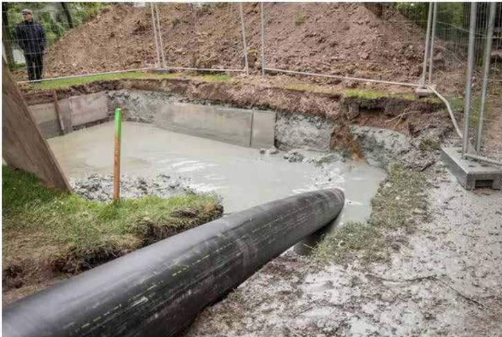
De buizen van het warmtenet lopen doorheen heel de stad. Hier een foto van de boring onder de Grote Bassin in 2017.