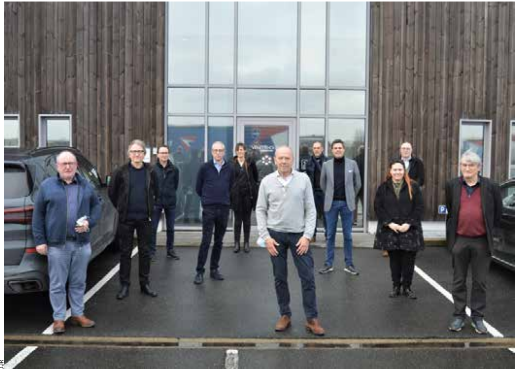
■ Met Grensland is Circulair gaan tachtig bedrijven een samenwerking aan om bij te dragen aan de circulaire economie.