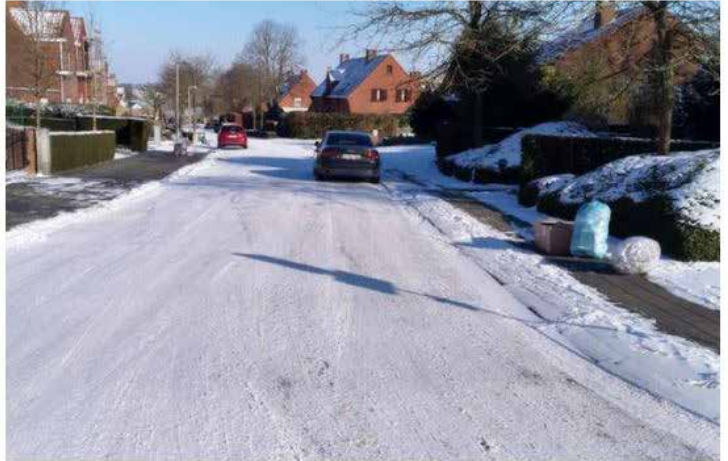
In zijstraten waar strooiwagens niet voorbijkomen, hebben de zware vuilniskarren het moeilijk.

D oor de sneeuw en ijzel verloopt ook de afvalophaling in Kortrijk minder vlot dan normaal. Sommige, vooral landelijke, wegen liggen er glad bij. Dat levert op verschillende plaatsen problemen op voor de grote vuilniswagens. “Maar voorlopig slagen de ophaalploegen van de stad er in om al het huisvuil op te halen door langer uit te rijden en kleinere, meer mobiele voertuigen in te zetten. Lukt dat toch niet, vraagt de stad om het afval terug binnen te nemen”, aldus de burgemeester.